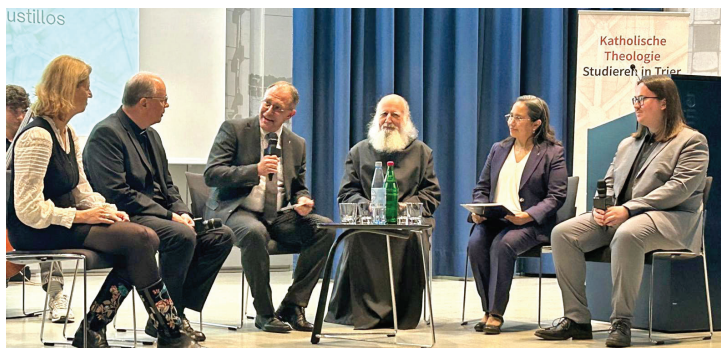
Delegación boliviana en el Festakt por los 75 años de la Facultad de Teología de Tréveris.

Esta participación reafirma el compromiso de la Facultad de Teología San Pablo con el diálogo académico internacional, la investigación teológica y la formación de excelencia, consolidando vínculos que permitirán el desarrollo de nuevos proyectos compartidos.