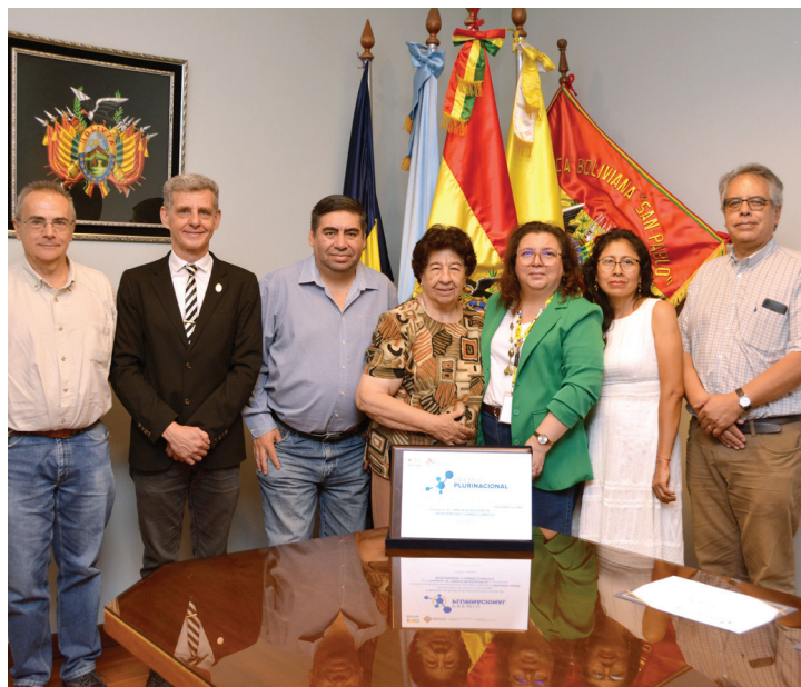
Parte del equipo interdisciplinario cuyo aporte al éxito del proyecto fue fundamental.

durante la ejecución del proyecto. “Este reconocimiento ratifica que la restauración ecológica participativa, cuando se construye junto a las comunidades y se sustenta en la ciencia, genera capacidades locales y resultados tangibles para recuperar la funcionalidad de los ecosistemas” – enfatizó.