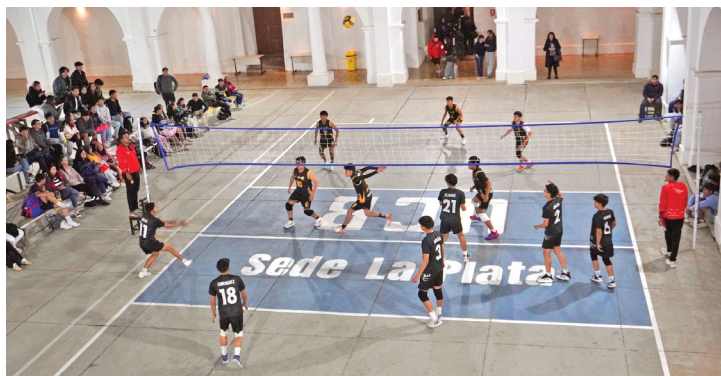
Colegios de Sucre compitiendo en el 2° Campeonato Intercolegial de Voleibol U.C.B. 2025.