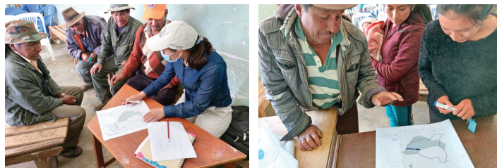
Comunarios de la comunidad de Virvini (Tiraque) aplicando la metodología EARLI.

Resultado final de la aplicación del modelo EARLI en el departamento de Cochabamba, realizado por el GADC.