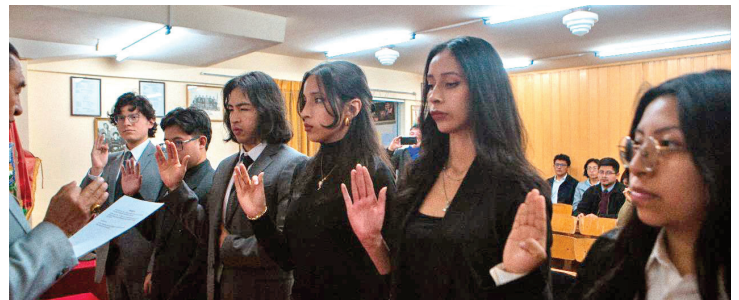
Momento inaugural de la Primera Sociedad Científica junto a autoridades y participantes.