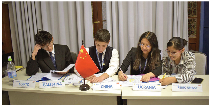
Delegados debaten soluciones jurídicas en el Platmun U.C.B. 2025.

El evento evidenció la preparación académica y el compromiso social de los participantes, consolidando a U.C.B. Sucre como semillero de líderes con visión global, capaces de representar a Bolivia en escenarios internacionales de diálogo y debate.