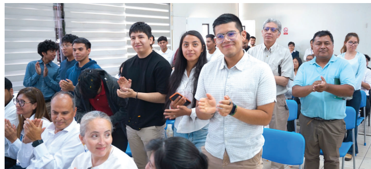
Estudiantes y docentes celebran el logro.