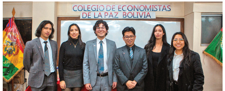
Directorio de la Sociedad Científica de Negocios Internacionales durante su presentación.

Desde la ePC - U.C.B. celebramos la creación de esta sociedad científica, ya que representa un avance significativo en la construcción de una comunidad académica más activa, crítica y orientada a resultados. Esta iniciativa reafirma el compromiso de la institución con la formación integral y la promoción de espacios que impulsen a los jóvenes a generar un impacto positivo en Bolivia a través del conocimiento, la investigación y la práctica profesional.