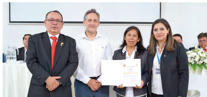
Entrega de informe de evaluación

voluntad de continuar trabajando con excelencia, transparencia y espíritu colaborativo para contribuir a la formación de profesionales capaces de transformar positivamente la sociedad boliviana.