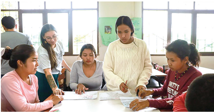
Creación de personajes con jóvenes en San José de Chiquitos

La Universidad Católica Boliviana “San Pablo” avanza en la implementación del proyecto “Una gota de cambio: un viaje animado para la concientización sobre el agua en Bolivia”. Una iniciativa de comunicación científica que articula investigación, educación y trabajo con comunidades para acercar el conocimiento sobre la gestión del agua a distintos territorios del país. En este marco, comenzaron los talleres de capacitación para la construcción de historias y personajes en tres regiones de Bolivia: primero en San José de Chiquitos, Santa Cruz; esta semana en La Maica, Cochabamba; y la próxima en Chojasivi, La Paz.