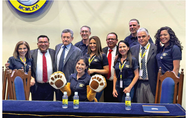
Comunidad representativa de Ingeniería Comercial comparten con representantes del CEUB.

Se ponderó a Ingeniería Civil por la amplia experiencia profesional de su plantel docente. Asimismo, se enfatizó positivamente el uso de equipos de computación y sistemas informáticos, que emplean distintos softwares específicos en asignaturas para los procesos de enseñanza y aprendizaje.