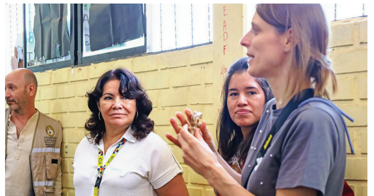
Jóvenes de San José de Chiquitos con el equipo Belga

La U.C.B. participa a través del INIE, CID, CICEI, IICC y los programas de diseño gráfico y diseño digital de las sedes de La Paz, Cochabamba y Santa Cruz.