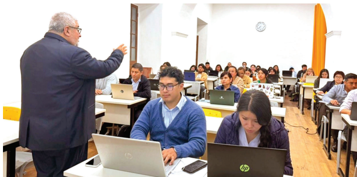
Curso de Argumentación Jurídica con IA fortalece competencias profesionales.

La Sede La Plata de la Universidad Católica Boliviana, en Sucre, reafirmó su misión institucional durante el último mes mediante diversas actividades que integran formación académica, vivencia de la fe y compromiso social, consolidando una propuesta educativa orientada al desarrollo integral de su comunidad.