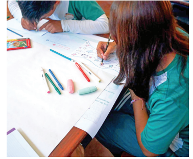
Creación de historias con jóvenes en San José de Chiquitos

cuando se traduce en procesos formativos, materiales educativos y espacios de co-creación que fortalecen capacidades locales frente a los desafíos del agua. Así, la universidad no solo investiga una problemática relevante, sino que acompaña a comunidades educativas en la apropiación de contenidos que pueden incidir en prácticas sostenibles y en una mayor conciencia ambiental.