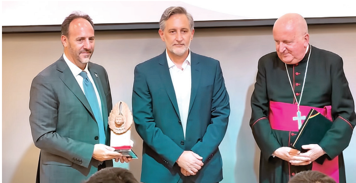
Entrega de presente institucional.