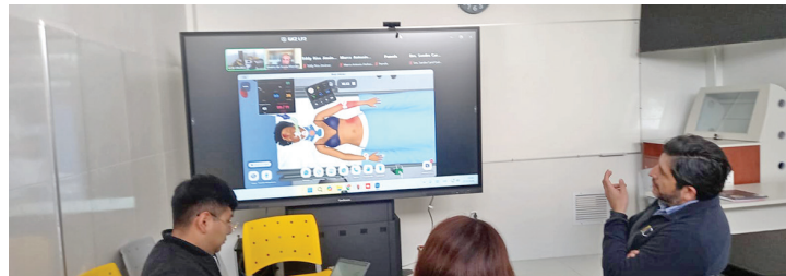
Moderna mesa anatómica, que fortalece la formación práctica en el área de salud

no solo representa una mejora en los procesos de enseñanza, sino también una apuesta firme por la innovación educativa.