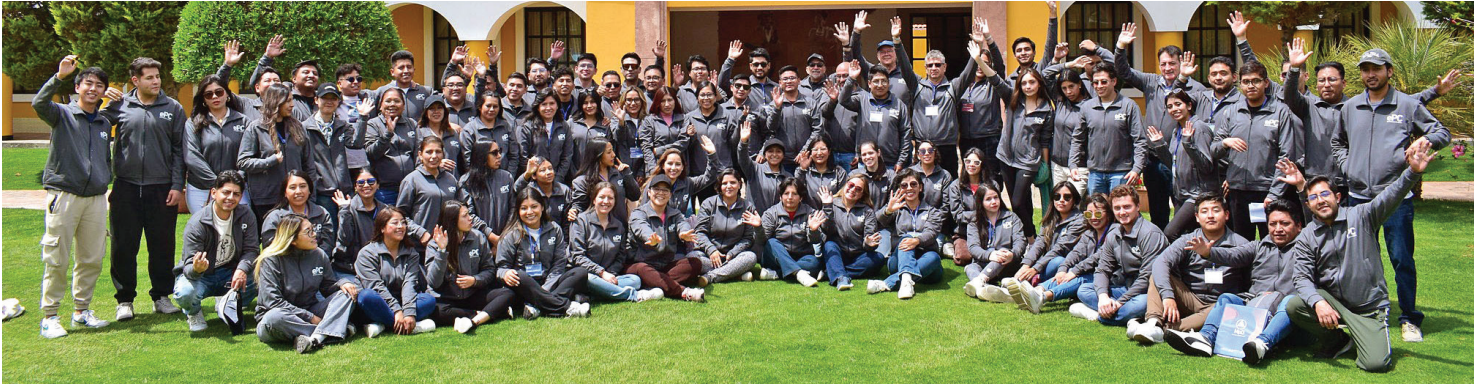
Participantes de los Días Intensivos MpD 2026, en una jornada que marca el inicio de su formación de posgrado

La ePC Business School expresó su agradecimiento a los maestrantes, al equipo académico y al Hotel Salquis Resort por su valioso apoyo en la realización de esta experiencia, que reafirma su compromiso con la formación de profesionales altamente capacitados al servicio del desarrollo.