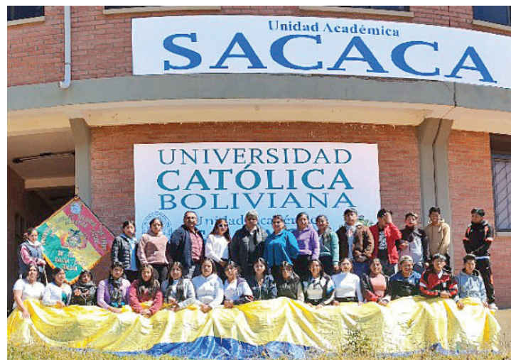
Estudiantes nuevos, gestión 2026, de la carrera de Licenciatura en Enfermería con autoridades de la UAS U.C.B. V.

Con estas acciones, la Unidad Académica Sacaca reafirma su compromiso con la innovación, la calidad educativa y la formación de profesionales al servicio de los demás.