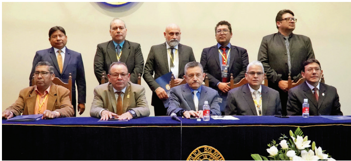
Comunidad representativa de Ingeniería Comercial comparten con representantes del CEUB.

Ingeniería Comercial destacó por el establecimiento de políticas claras sobre líneas de investigación, desarrollo científico e interacción social, poniendo de relieve los trabajos encarados por docentes y estudiantes, con resultados objetivos, debidamente documentados y publicados en revistas especializadas.