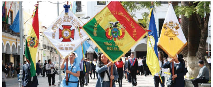
Banderas y estandartes institucionales marcaron la celebración de los 60 años.