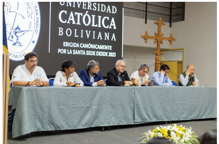
Mesa de diálogo del día 3 “Rol de la Sociedad ante la Crisis Climática”, Santa Cruz 2024

Además de conferencias y paneles especializados, el evento promoverá espacios de trabajo colaborativo destinados a vincular iniciativas de investigación, proyectos de desarrollo, experiencias comunitarias y estrategias de gestión pública. La finalidad es que los distintos actores puedan compartir conocimientos, identificar oportunidades de cooperación y construir propuestas conjuntas que contribuyan a enfrentar los efectos de la crisis climática desde una perspectiva integral.