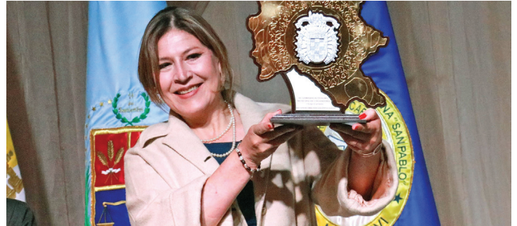
Reconocimientos destacan seis décadas de contribución al país en varios ámbitos.