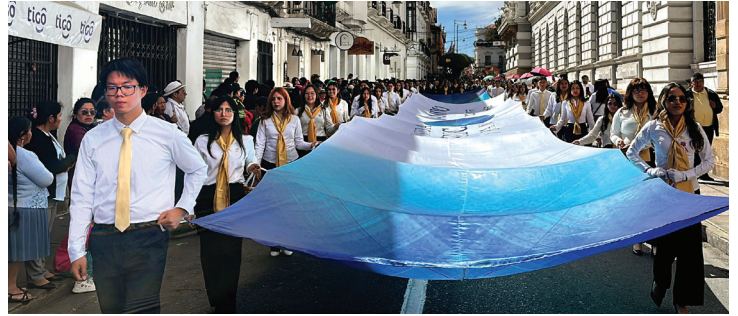
DESFILE CÍVICO DEL 25 DE MAYO: Estudiantes portan con orgullo la gran bandera conmemorativa de los 60 años de la Universidad Católica Boliviana “San Pablo” Sede La Plata – Sucre. Durante el desfile del 25 de mayo.

Las actividades también fortalecieron el compromiso de la