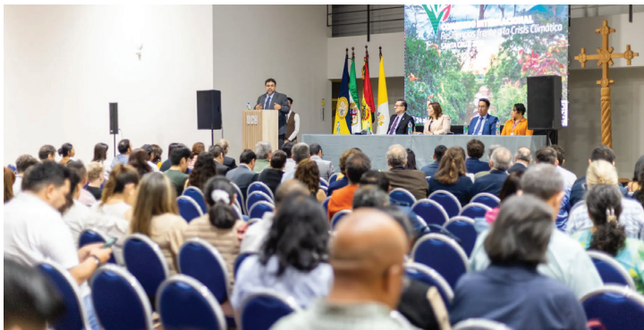
Acto de inauguración del Congreso Resiliencias frente a la Crisis Climática, Santa Cruz 2024

La realización del Congreso responde al compromiso asumido por la U.C.B. al cierre de la segunda versión del encuentro internacional, realizada en 2024 en la ciudad de Santa Cruz. En aquella oportunidad, los participantes reafirmaron la necesidad de fortalecer el trabajo conjunto entre diversos sectores y avanzar hacia respuestas integrales, solidarias y concretas frente a la crisis climática. Sobre esta base, la tercera versión busca consolidar un espacio permanente de encuentro que permita transformar compromisos en acciones colectivas con impacto real en los territorios.