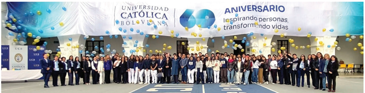
CELEBRACIÓN DEL 14 DE MAYO: Una monumental bandera y una colorida lluvia de globos enmarcan el orgullo de la comunidad de la Universidad Católica - Sede La Plata en el día central de los 60 años de la UCB.

Al concluir este mes festivo, la U.C.B. Sede La Plata reafirma su compromiso con la formación integral, la excelencia académica y el servicio a la sociedad.